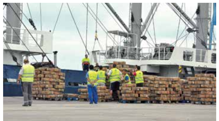
Trabajadores portuarios organizando en cajas pescado congelado en Las Palmas.

El Reglamento INDNR de la Unión Europea ofrece un gran potencial para detener la importación de productos pesqueros ilegales al mayor mercado mundial de pescado, desalentando así a los operadores de pesca INDNR de todo el mundo; sin embargo, para conseguirlo es fundamental que el reglamento se aplique íntegramente.